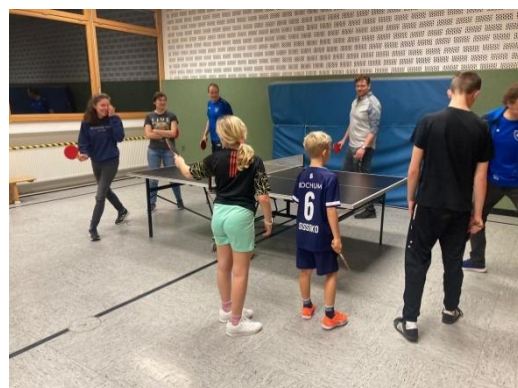
Bilder privat: Turniersieger und Dritter bei der Siegerehrung / Rundlauf bis kurz vor Mitternacht