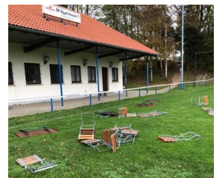
(Tat-Nacht: Halloween 31.10.22)

Das muss doch wohl nicht sein! Wieder sind wir Opfer von Sachbeschädigung und Vandalismus geworden und haben schlichtweg einfach keine Lust mehr - als gemeinnütziger Verein, der einen Großteil seiner Energie und Schaffenskraft in Kinder- und Jugendarbeit steckt - wiederholt Opfer von Randale und Zerstörungswut zu sein! Gerne nehmen wir sachdienliche Hinweise entgegen (A. Wohlleb), werden diese dann zu polizeilicher Anzeige bringen und bitten inständig (!!!) alle Eltern, verantwortungsbewusst auf ihre Jugendlichen einzuwirken, dass sowas zu unterlassen hat! DAS IST KEIN HALOOWEEN-STREICH SONDERN PURE UND MUTWILLIGE SACHBESCHÄDIGUNG!!!